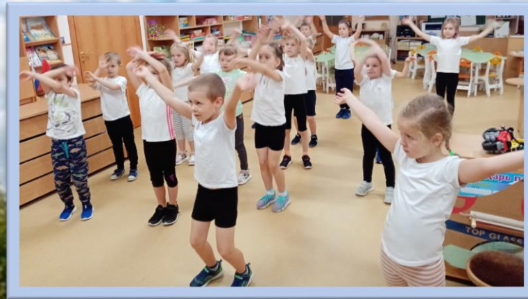
Пальчиковая гимнастика «Листопад»