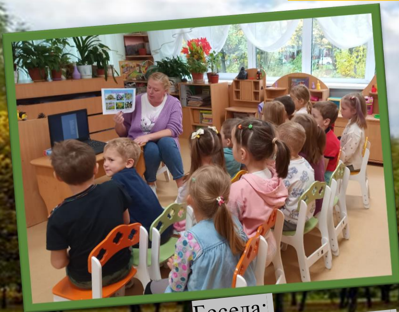
Беседа: «Кому нужны деревья в парке?»