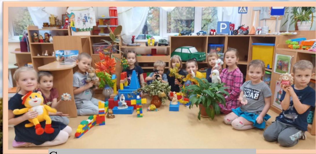
Строительно-конструктивная игра «Прогулка по парку»