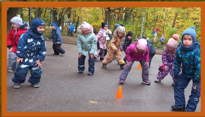
Подвижная игра «Сбей шишки»