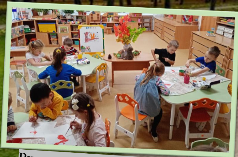
Рисование «Белка на дереве»