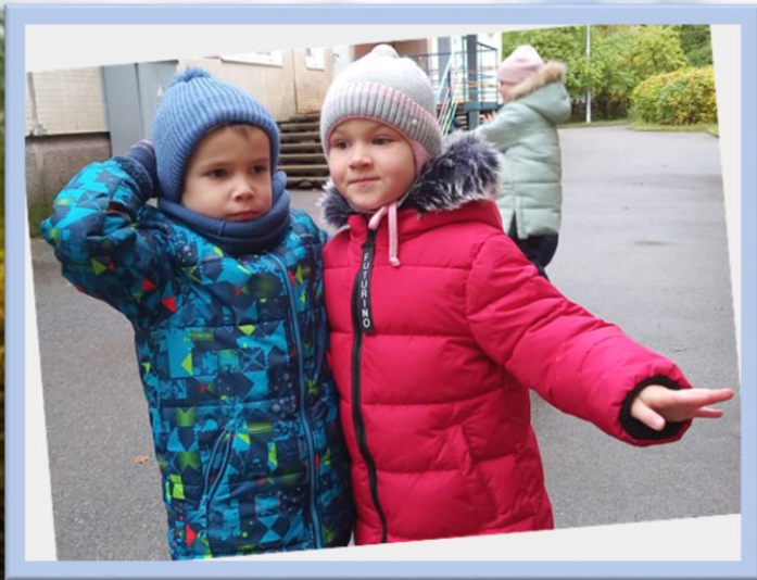
Подвижная игра «Садовник и цветы»