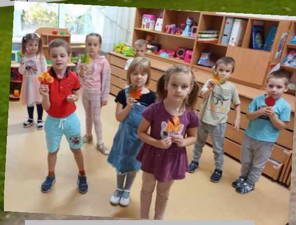
ДИ «Узнай чей лист?»