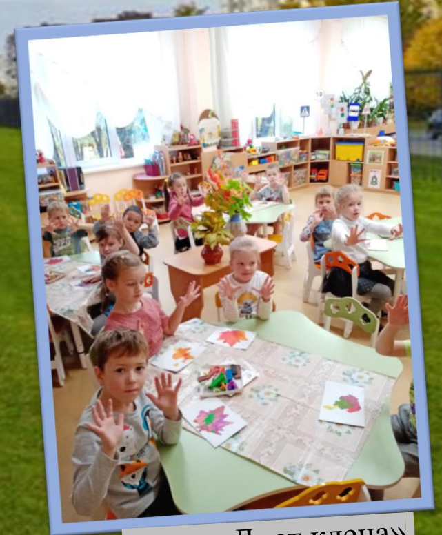
Лепка «Лист клена»