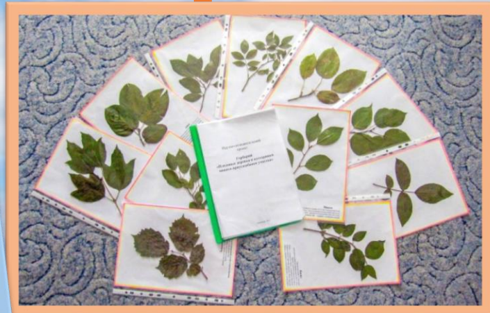
Создание гербария: «Раз листочек, два листочек»