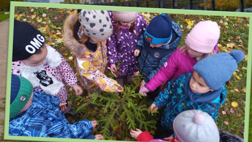
Беседа: «Почему растения имеют большое значение не только для птиц, животных, но и для человека»