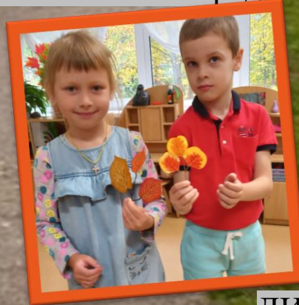
ДИ «Найди пару»