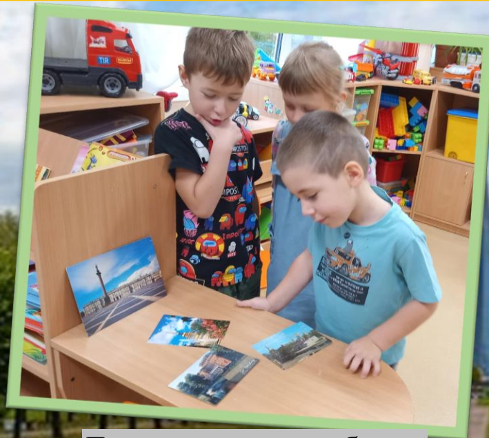
Демонстрация альбома: «Природные достопримечательности города»