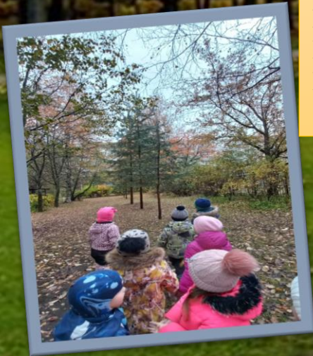
Сюжетно-ролевая игра «В парке»