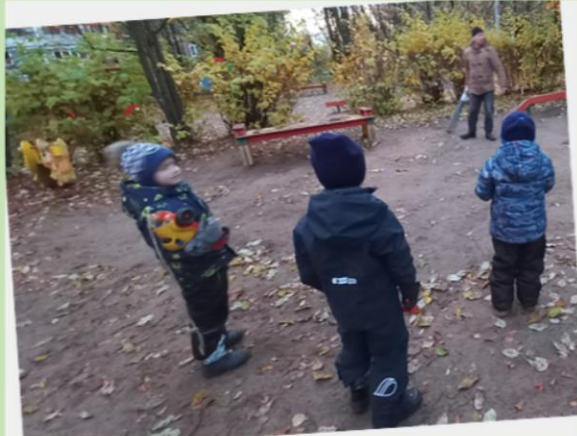
Наблюдение за работой дворника