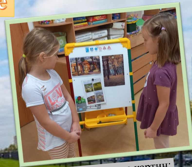
Рассматривание картин: «Парки и сады Санкт-Петербурга»